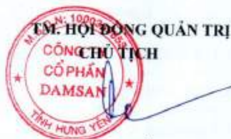
VŨ HUY ĐỒNG